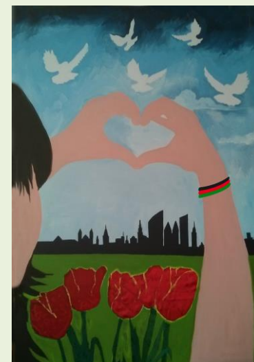
Verhalen van Afghaanse vrouwen uit Den Haag verwerkt in schilderijen in samenwerking met Sam Massoud