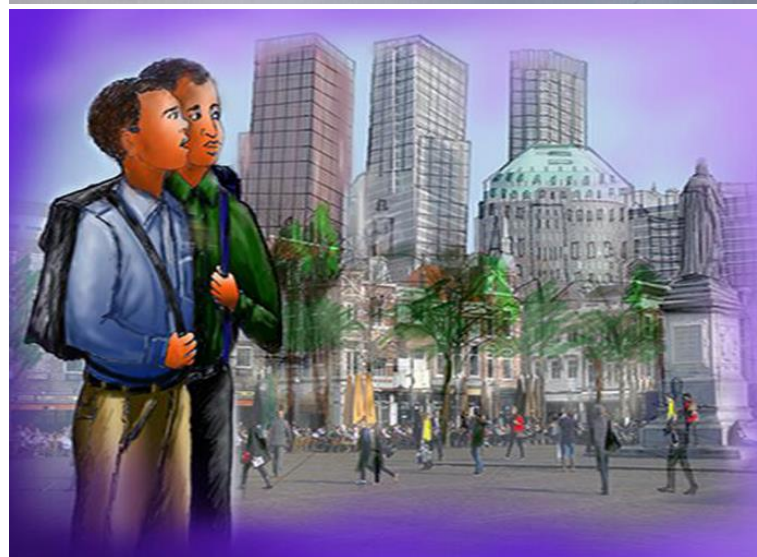
Verhalen van Somaliërs uit Den Haag verwerkt in tekeningen door Gaxtaan