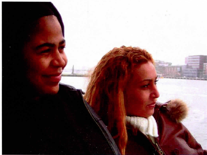
Mina en Rolanda

Laten we nu samen proberen alles beter te maken